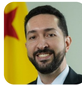
Luciano Fleming Leitão Procurador do Estado designado para atuação junto à Presidência do TCE/AC