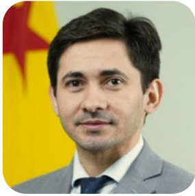
Luís Cabral Morais Procurador do Estado