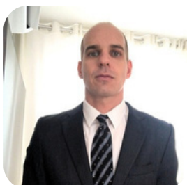
Fábio Marcon Leonetti Procurador do Estado