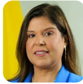
Caterine Vasconcelos de Castro Procuradora do Estado