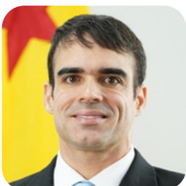
Gustavo Faria Valadares Procurador do Estado