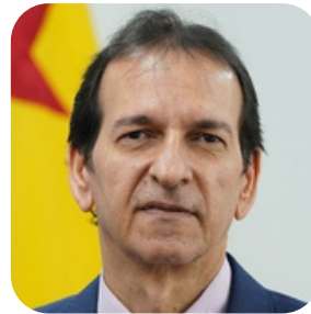
Mauro Ulisses Cardoso Modesto Procurador do Estado