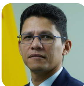
Marcos Antônio Santiago Motta Procurador do Estado designado para atuação junto à Presidência da ALEAC