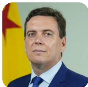
Leandro Rodrigues Postigo Procurador do Estado