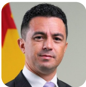
Francisco Armando de Figueiredo Melo Procurador do Estado