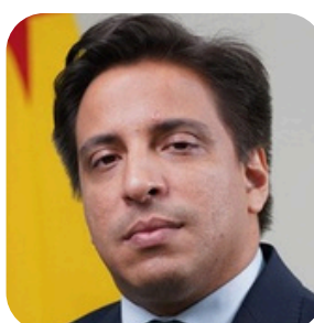
Cristovam Pontes de Moura Subchefe para Assuntos Jurídicos da Casa Civil