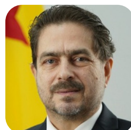
Tito Costa de Oliveira Procurador do Estado